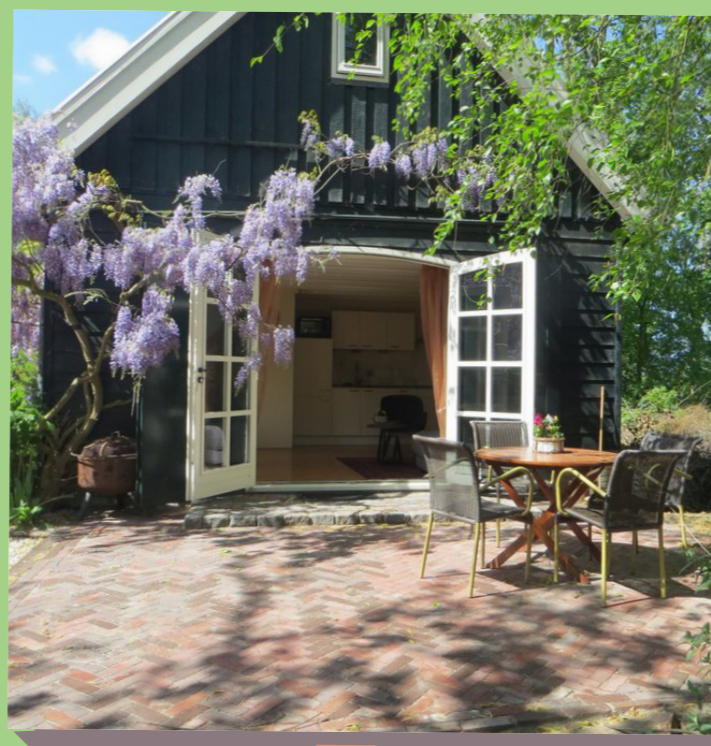
Bed & Breakfast