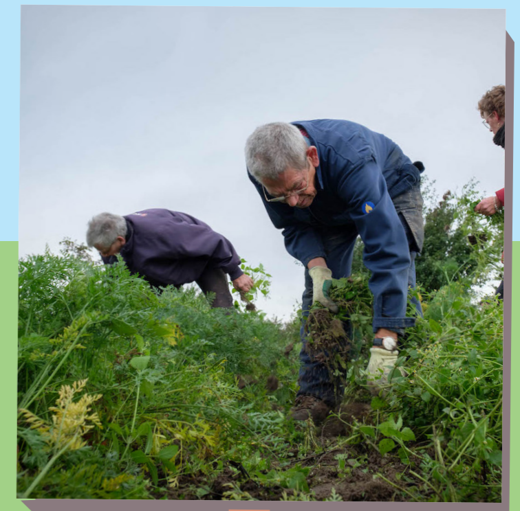
Zelf plukken of oogsten