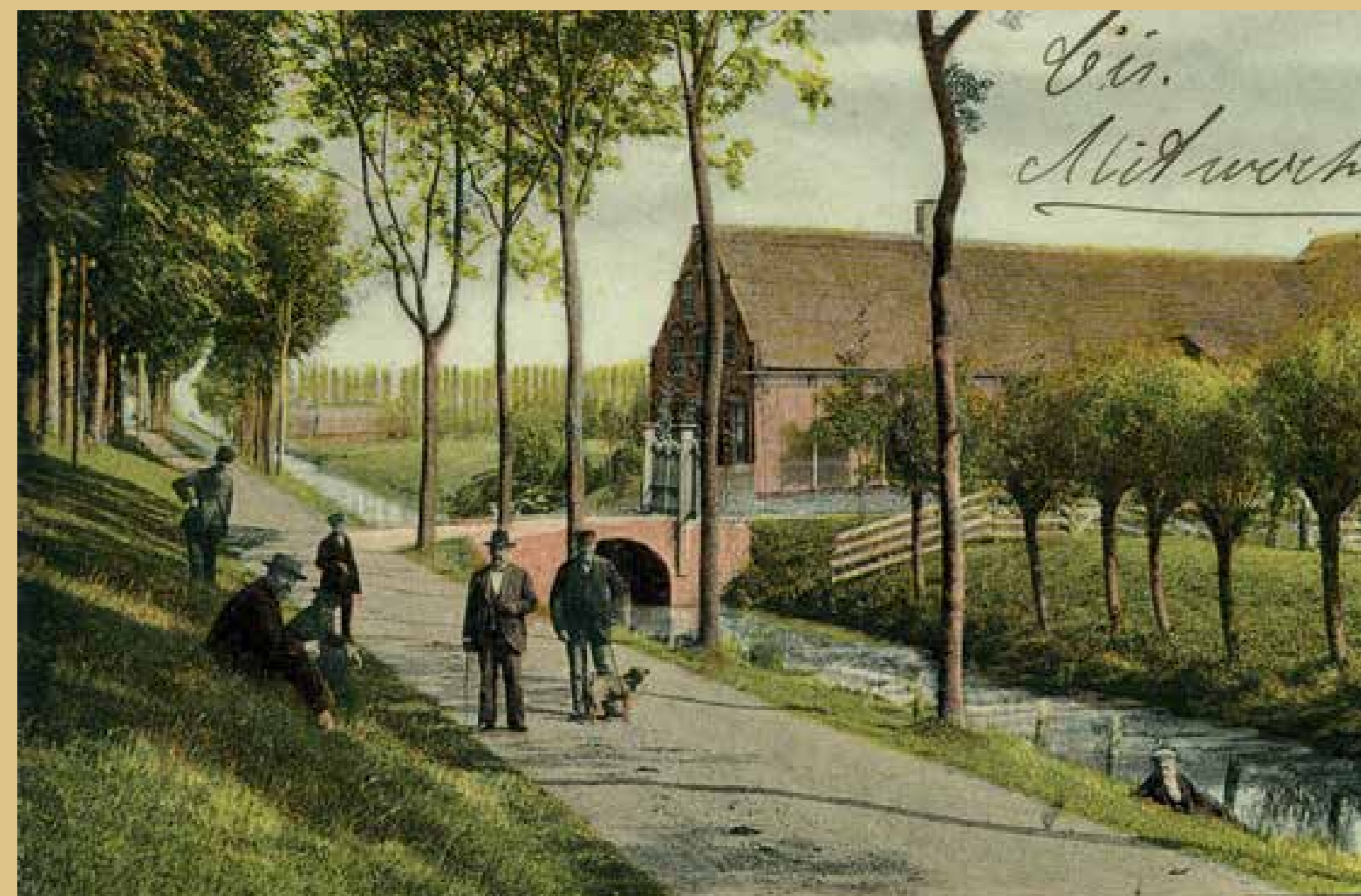
Even Buiten Oud-Beijerland