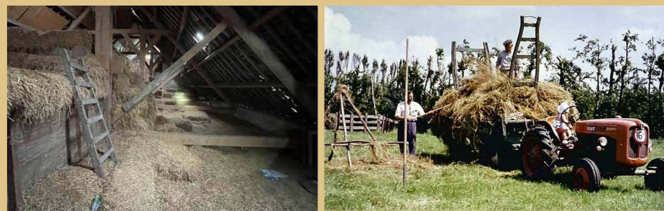
Sfeer van weleer