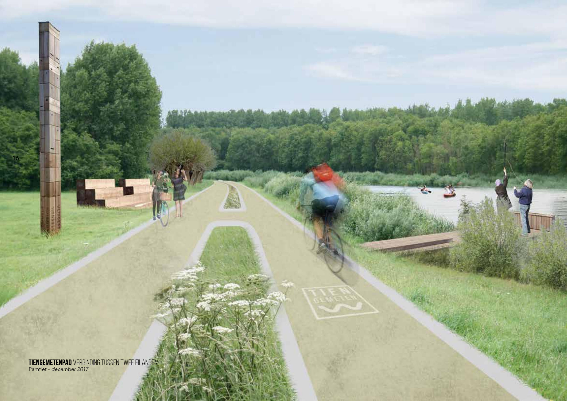
TIENGEMETENPAD VERBINDING TUSSEN TWEE EILANDEN Pamflet - december 2017