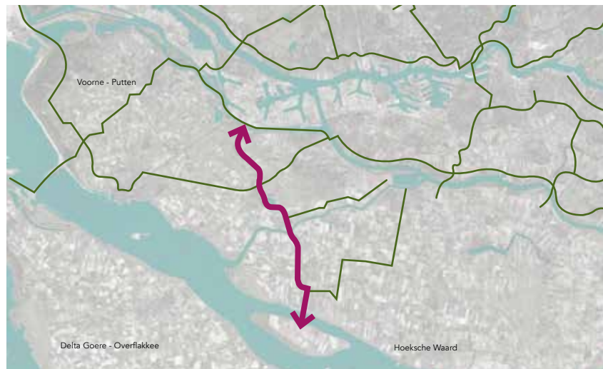
Tiengemetenpad als ontbrekende schakel in de Hollandse Banen