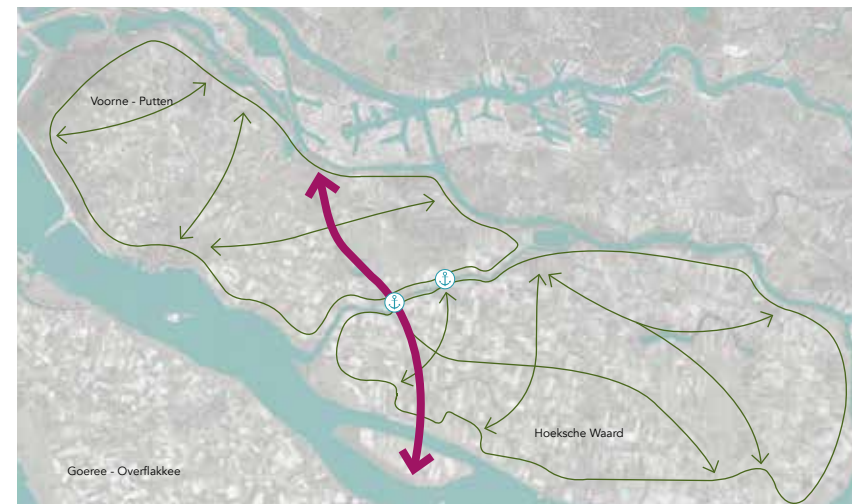
Tiengemetepad als aanvulling op het routenetwerk