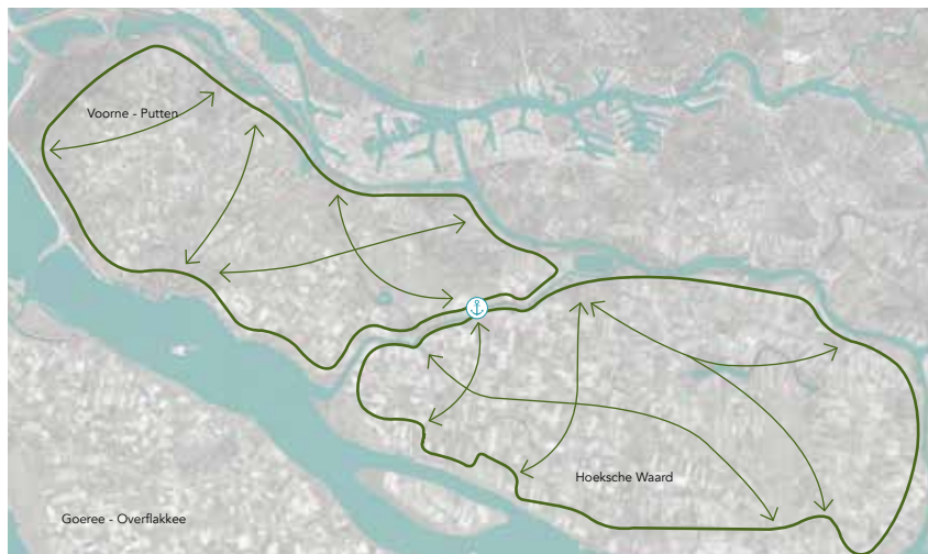
de bestaande fietsroutenetwerken