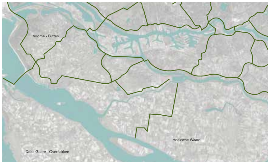
concept van de Hollandse Banen, vanuit de MRDH