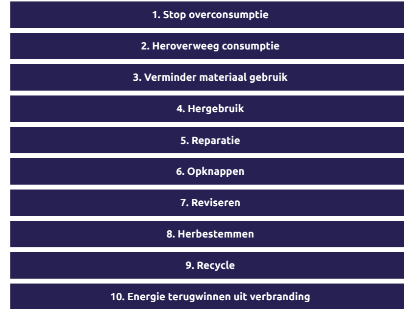
Figuur: ladder met strategieën circulaire economie

Recycling is duurder en minder impactvol dan het voorkomen van afval door bijvoorbeeld hergebruik of verminderen van consumptie. Maar als er uiteindelijk toch afval ontstaat dat niet hergebruikt kan worden, zullen we de producten zo hoogwaardig mogelijk moeten recycleren. Hoogwaardig recycleren betekent zo min mogelijk kwaliteitsverlies van de grondstoffen waar een product uit bestaat. Hoogwaardig recycleren zorgt er (over het algemeen) voor dat grondstoffen meerdere malen opnieuw gerecycled kunnen worden. Laagwaardig recycleren zorgt er (over het algemeen) voor dat de grondstof na eenmaal recycling alsnog verbrand moet