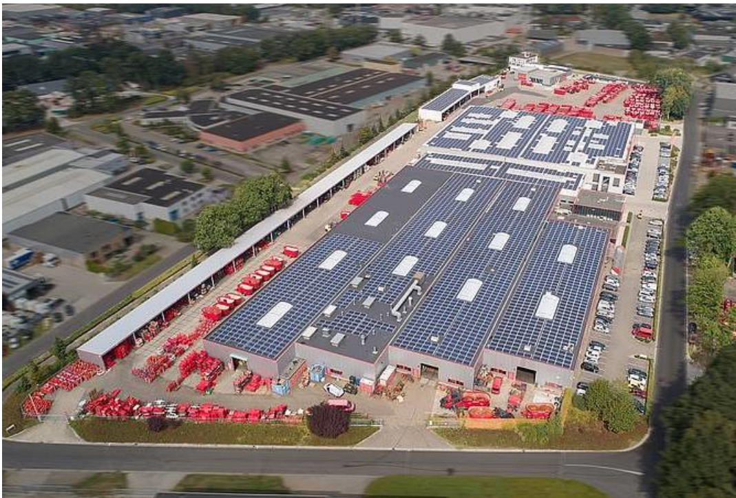
Foto: 4.400 zonnepanelen op het dak van Trioliet in Oldenzaal, goed voor ca. 1.000.000 kWh per jaar.

Wilt u meer weten over het onafhankelijke adviesproject Energieke Regio? Kijk dan op www.energiekeregio.nl of neem contact op via info@energiekeregio.nl .